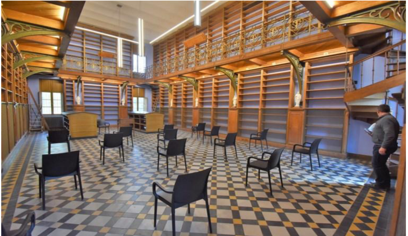
De bibliotheek in de abdij werd in 1872 in gebruik genomen. Het is een bibliotheek van twee verdiepingen met een gaanderij.

De waardevolle bibliotheekcollectie was door een grote groep vrijwilligers in 2013-2014 al geïnventariseerd en ingepakt. Meer dan 1.200 grote verhuisdozen met meer dan 50.000 boekbanden werden geïnventariseerd. Sinds 2016 is de collectie tijdelijk gestockeerd in het Rijksarchief in Beveren.