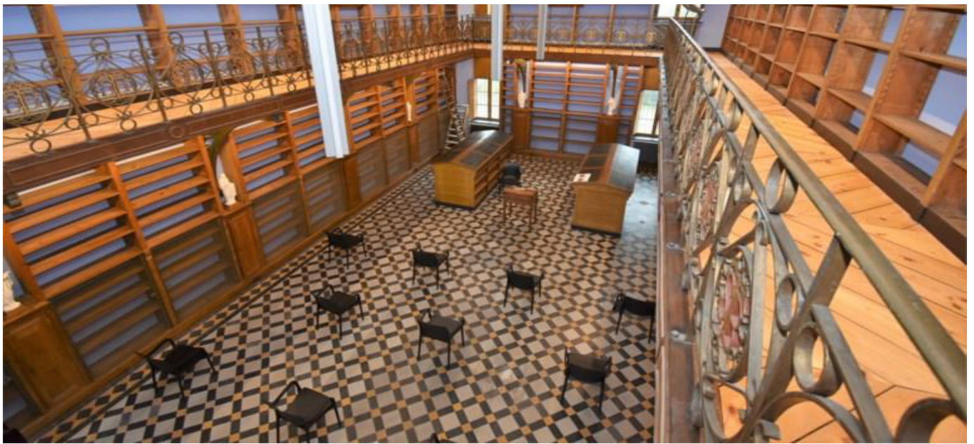
Op de verdieping van de bibliotheek is ook de zogeheten 'hel'.

In de bibliotheek stonden tot enige decennia terug twee rijen pulpita: brede en zware houten lezenaars met schuin oplopend blad. Twee van die pulpita kregen een plaats in de gerestaureerde bibliotheek.