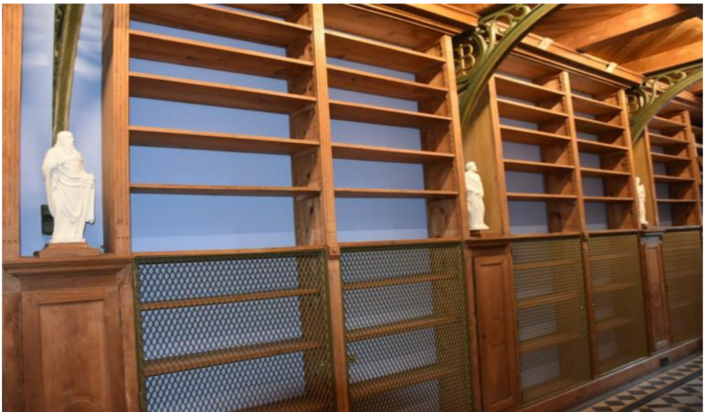
De beelden van de twaalf apostelen komen na de restauratie veel meer tot hun recht.